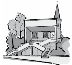
Zu den Erbhöfen 37a

Mo Di 9.00 -12.00 Uhr Mi 9.00 -12.00 Uhr Do 9.00 -12.00 Uhr und 15.00 - 17.00 Uhr Fr 9.00 -11.00 Uhr